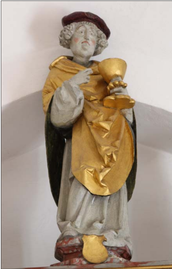
Sct. Kjeld på toppen af alteret i Åby Kirke

I Åby Kirke, Åbybro, har Sct. Kjeld fået en fornem placering, nemlig som en 75 cm høj bemalt træfigur øverst på altertavlen.