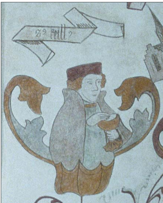
Sct. Kjeld i Vor Frue Kirke i Skive.

I venstre hånd bærer han en kalk, som han velsigner med højre hånd. Kalken og kappen er forgyldte.