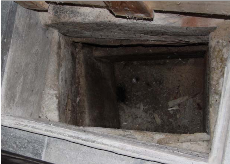
Sct. Kjeld Brønd i kryptens søndre kapel

”Sct. Kjelds Ark” gik til grunde i 1726, da det meste af Viborg by inklusiv domkirken blev lagt øde af en stor brand.