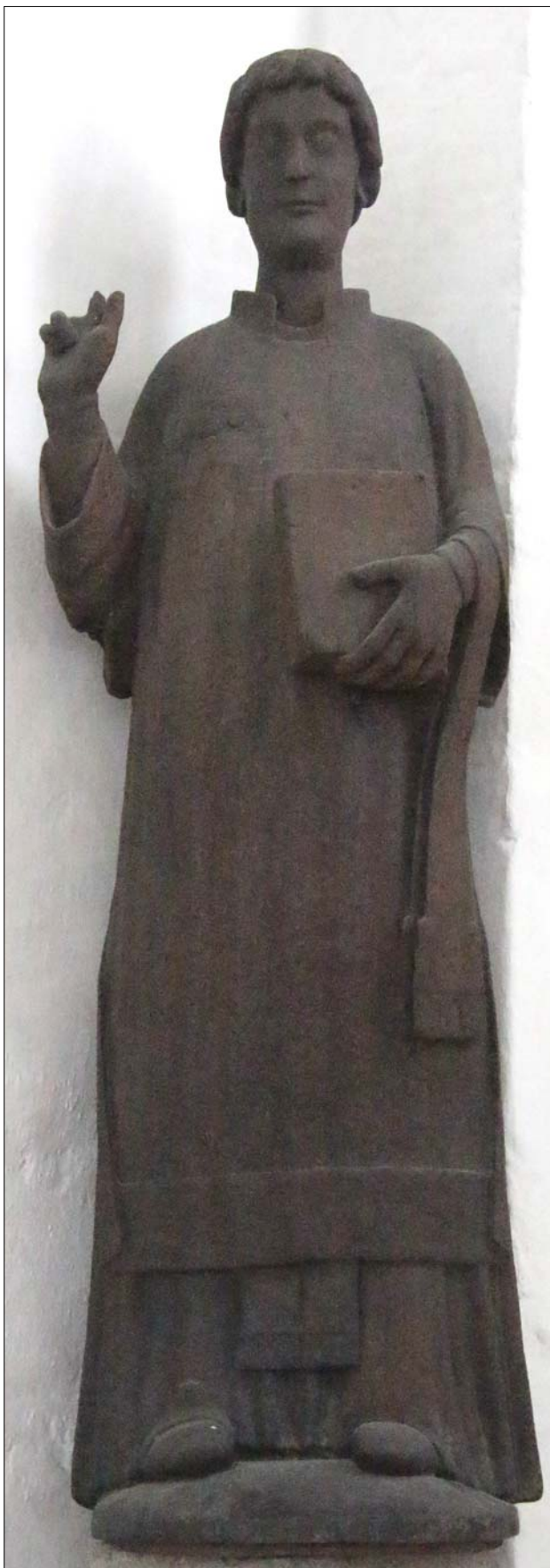
Sct. Kjeld i Øster Hornum Kirke